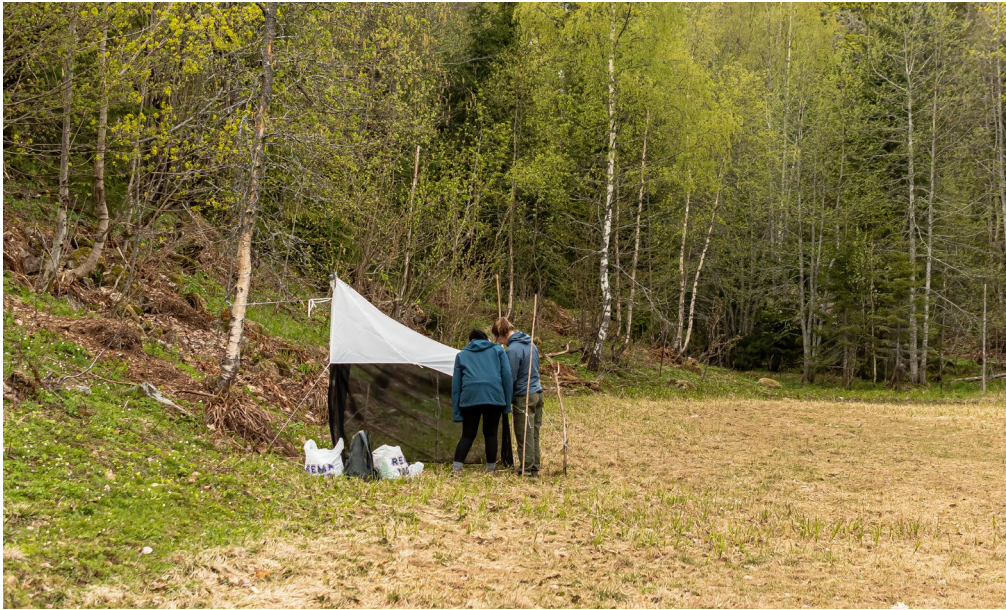
Utsetting av Malaise telt ved Kjelsaas gard med Ung Entomolog.