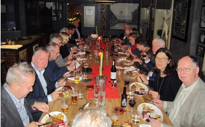
Drammenslagets 40-års jubileum på Johan B. Gundersens restaurant i Drammen.