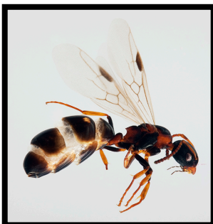
En av godbitene som ble funnet på artskurset var firfleckmaur. Arten er kun påvist på noen ytterst få lokaliteter ved Oslofjorden.