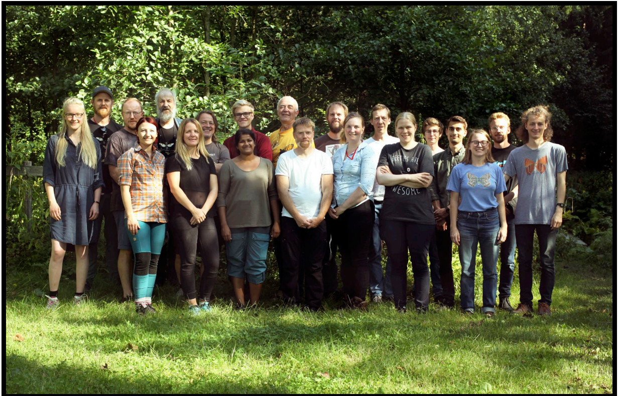
Ivrig deltager på Norsk entomologisk forenings maurkurs 2019.